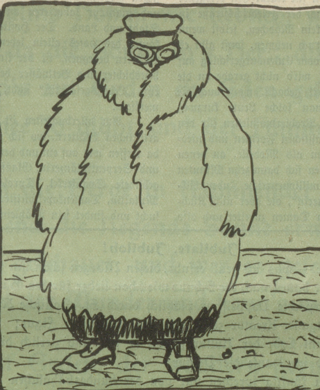
Portrait des Siegers der Autowettfahrt.