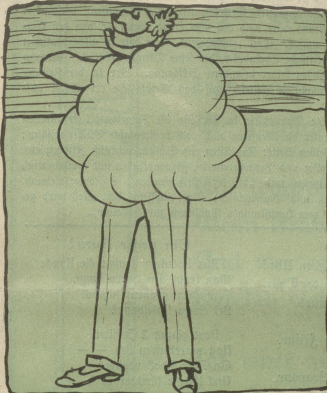
Portrait des schweiz. Meisterschützen in Honn.