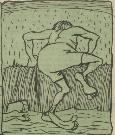
Portrait des Siegers beim Hellschwimmen im Zürichsee.