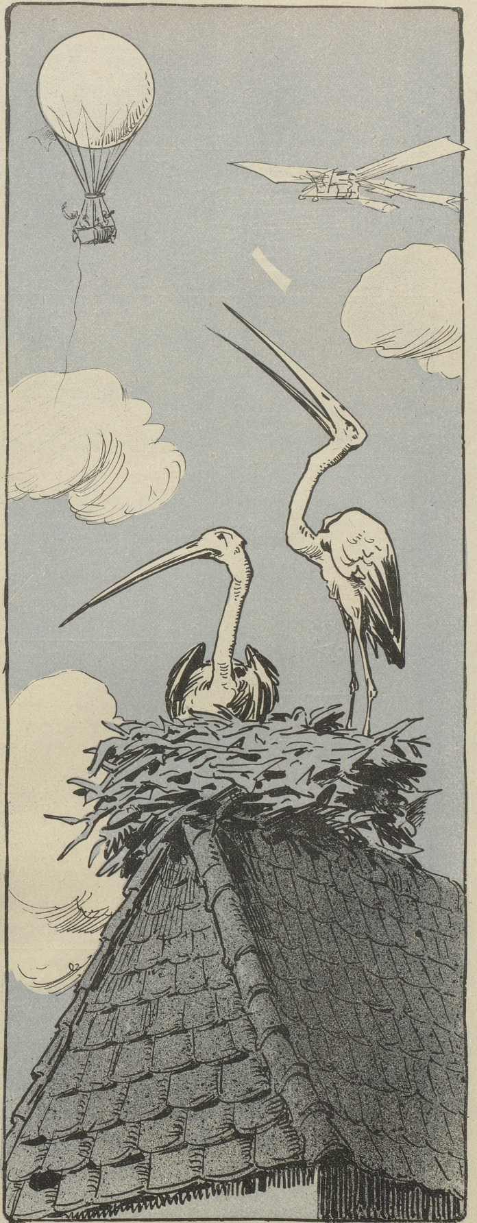
Die Protzen dort oben wären ja gar nicht geboren, wenn wir das nicht schon längst gekonnt hätten!