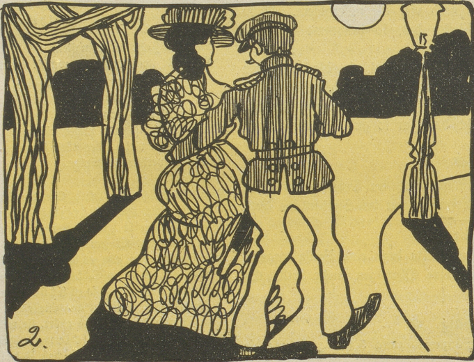
2. Auch Süßholz läßt sich gut versteuern, Wenn Pärchen Stiebesorgen feiern!