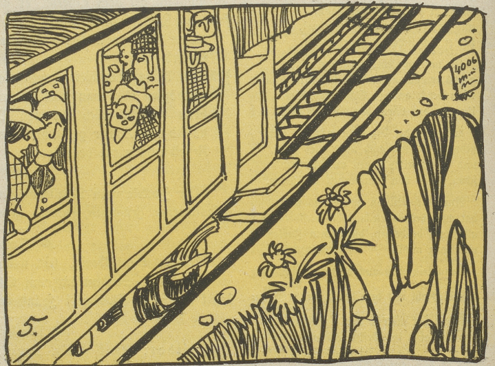
5. Wer in die Schweiz reißt, so wie heuer, Dem bülhe eine Bergbahnsteuer!