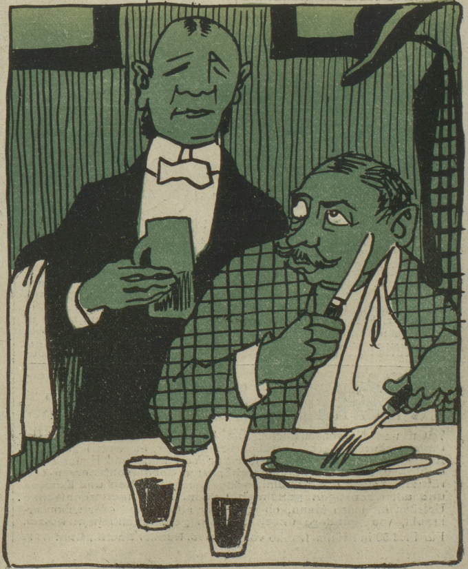
Kellner: Ist das Beefsteak vielleicht etwas zähe? — Gast: Macht nix, ich werde schon fertig damit, ich bin gelernter Bohrer...