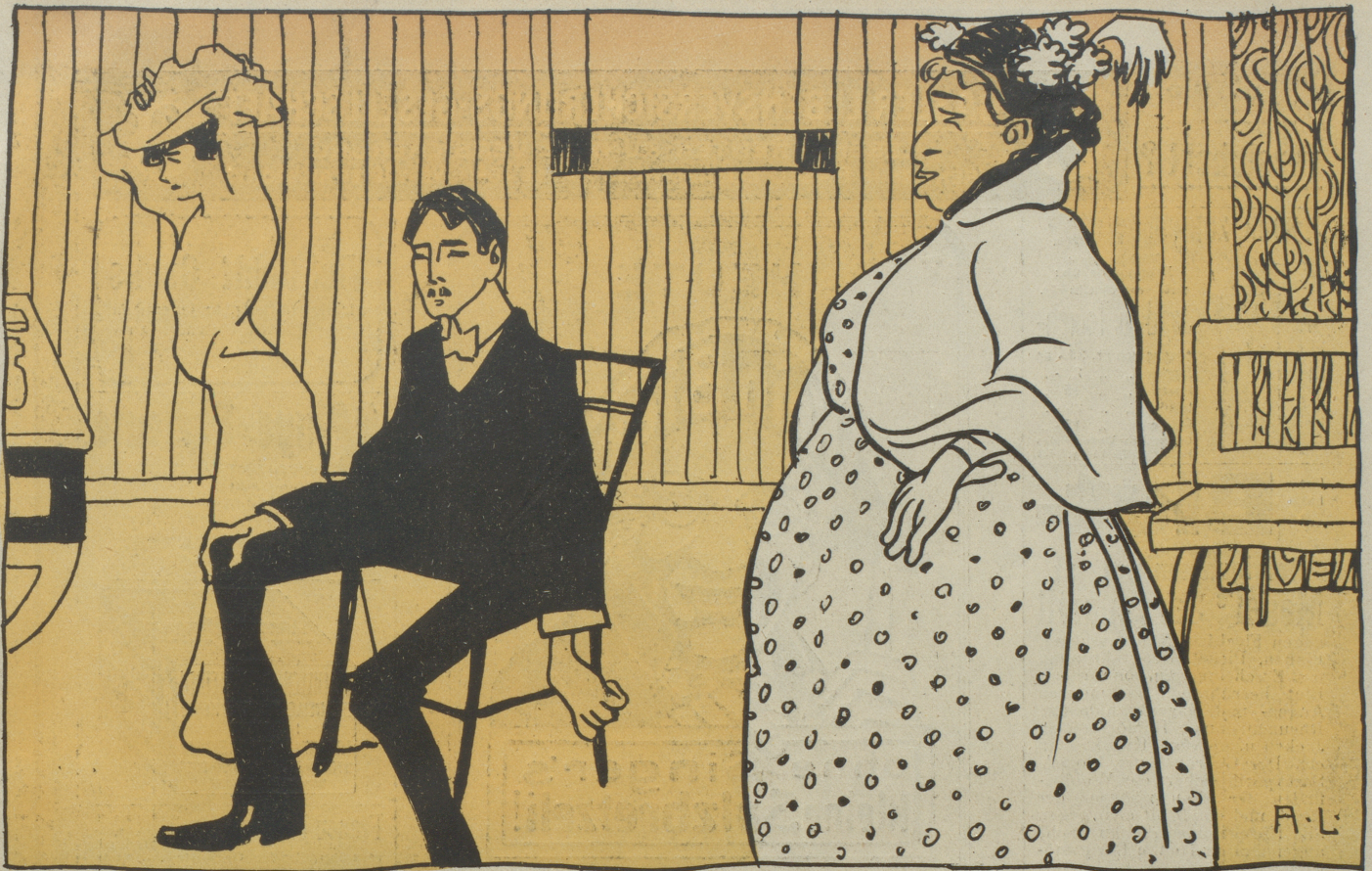
Schwiegermama (zu Besuch): Was soll ich denn morgen für ein Kleid anziehen? — Schwiegersohn: Das Reisekleid, liebe Schwiegermama...