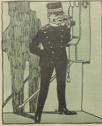
Wenn Sie Submissionspreis um \frac{1}{4} Frank reduzieren, können Sie uns 50 Wagen Häfer Nr. 15 zuführen.