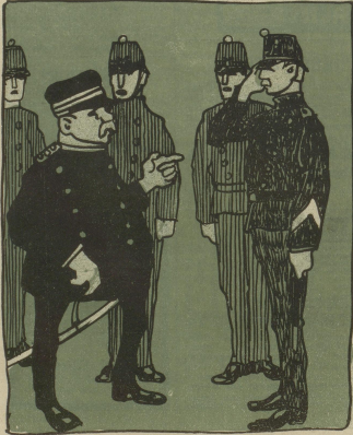
Meine Herren Soldaten, Sie sind uns viel zu teuer. (Drum wird aus der Lieferung wiederum nix heuer.)