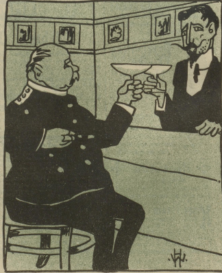
Mon ami, nous vous donnent 100 vaggons a livrer. (Darauf findet sich absolut kein Reim.)