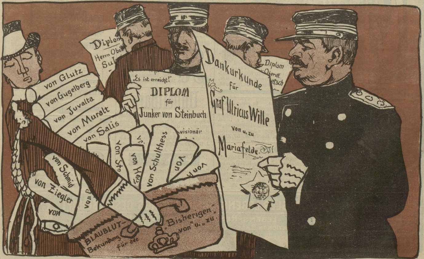
Neue Zürcher Nachrichten No. 216: „Schweizerische Militärpersonen dürfen keine Orden annehmen; der Kaiser läßt ihnen daher künstlerisch ausgeführte Ehrenurkunden überreichen.“