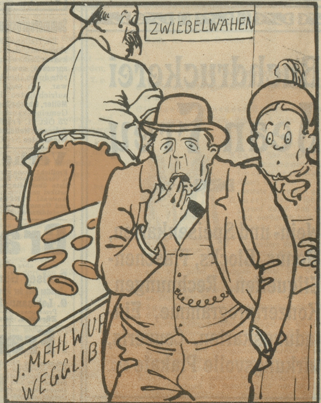
Queg, Zilli, das ischt emal äs Zinkereggli rote's de Bruuch ischt.