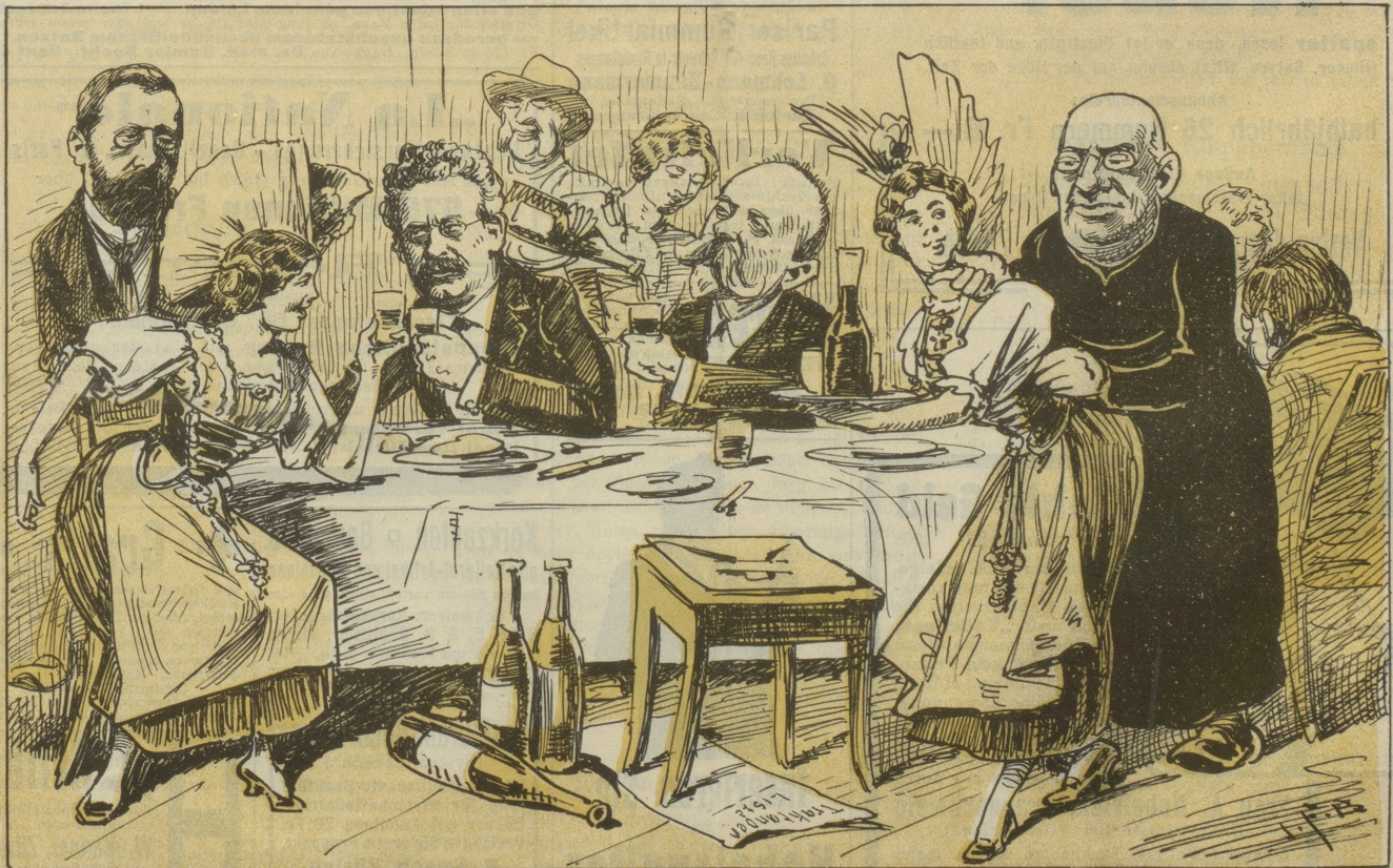
Nach der Tage Arbeit feiern die Delegierten bei den „Sifsgeli“ in Appenzell ihren Abschied.