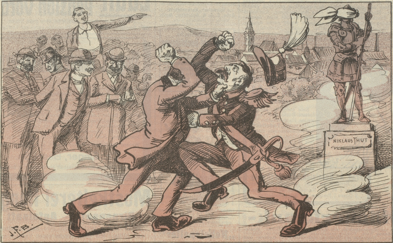
Die Optimisten im Kulturkanton betrachten dies als Training im Tsü-tsütsü.