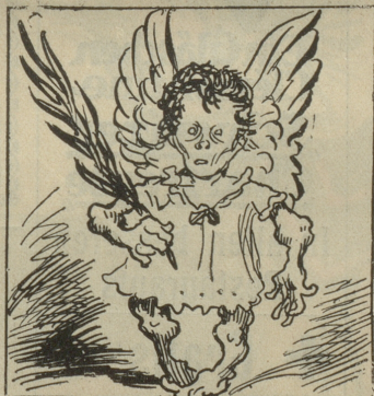
kann seine englische Herkunft nicht leugnen. Er leidet an englischer Krankheit

unter der Laterne“. Er sprach von „Erziehung zur Ehe“, der „Sittlichen Sorderung“ und „Moral“, das sei bei ihm „Das Prinzip“, worauf sie erwiderte, er sehe „Gespenster“ und mache „Ziel Lärm um Nichts“. Ihr Wahlpruch sei „Es lebe das Leben“ und sie hätte gern eine „Liebele“, aber sie liebe „Ehrliche Arbeit“ und ihre „Ehre“, und sie mache nicht „Alles um Geld“ wie andere „Slotte Weiber“. Sie liebe „Plauderstunden“ „Im Clubseffel“ über „Literatur“ und „Musik“. „Weh dem der lügt“ war sein „Lehtes Wort“. Wie „Romeo und Julia“ gingen sie ins Hotel zum „Bahn“, fuchten ihr „Nacht-lager“ auf und träumten wie die „Königskinder“ von „Lohengrin“ und „Sigeunerbaron“. Aber er sollte nur „König für einen Tag“ sein, denn am nächsten Morgen verlangte „Magdalena“, sein „Puppenmädel“, er solle mit ihr „I. Klasse“ ins „Weite Land“ zu ihren „Särtlichen Verwandten“ nach „Alt Wien“ fahren, denn dort wohne ihr „Papa“. Er nannte das einen „Tollen Einfall“, er könne die „Großstadtluft“ nicht vertragen und schließlich könne er als „Idealer Gatte“ keine „Doppelche“ eingehen. „Räuber“