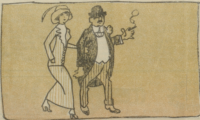
Die Rosa geht mit Don Juan.