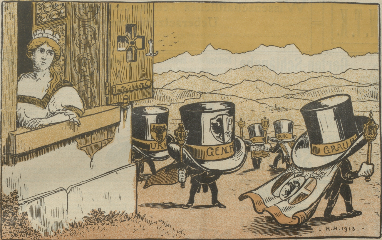
Wiederum marschirt der Kantönligeist voran!