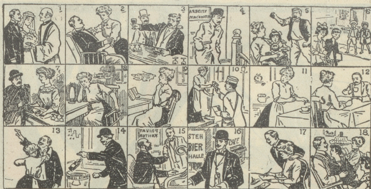
Diese 18 Bilder erzählen eine ganze Geschichte. Ein Kind kann sie verstehen.