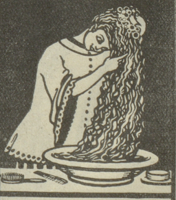
Kopfwashungen mit Grolichs Heublumenseife entfernen Schuppen, stärken den Haarboden und machen das Haar voll und wellig.