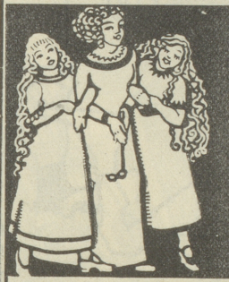
Frauen und Mädchen sind von der wunderbaren Wirkung von Grolichs Heublumenseife überzeugt u. kaufen nur diese.

Grosse, neu renovierte Säle für Hochzeiten, Gesellschaften und Vereinsanlässe. Prächtiger, schattiger Garten mit Rosenlauben direkt am See. Ponton für Klub- und Motorboote. Exquisite Küche und Keller. — Spezialität: Fische. Pensionspreis von 5 Fr. an. 1275 Telephon-Nr. 10 — Bad. Elektr. Licht. — Telephon-Nr. 10