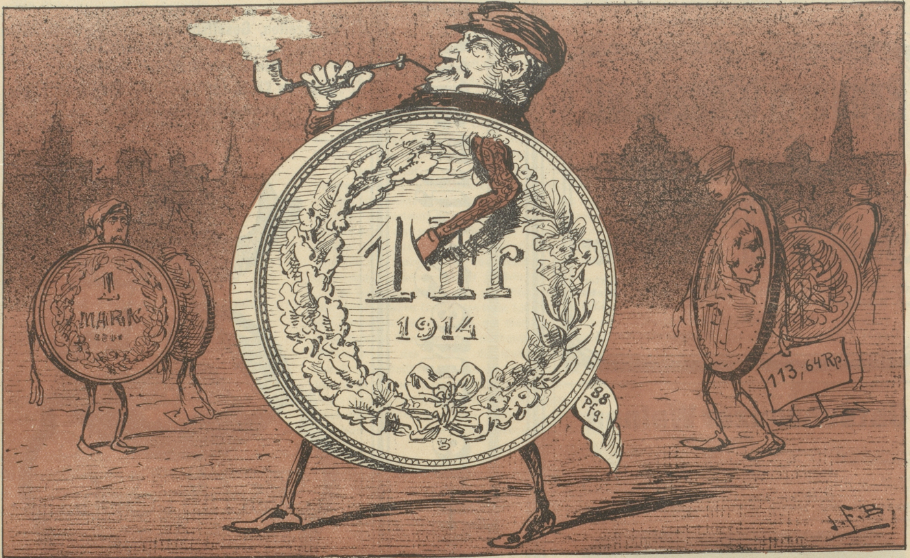
Seitdem der Schweizerfranken bemerkt hat, daß er 88 Pfennig wert ist, wird er immer aufgeblasener.