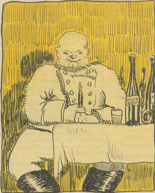
Aus einem Feldpostbrev.