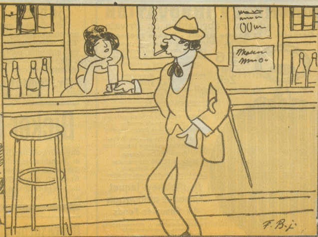
6. und setzte zum Schluß in einer american Bar einen schwedischen Punsch drauf.