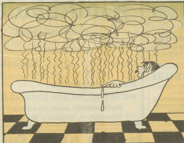
1. In der Früh nahm ich ein türkisches Dampfbad,