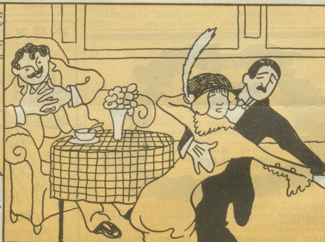
4. und nachmittags ließ ich mir beim five-o'clock-tea argentinischen Tango vortanzen.