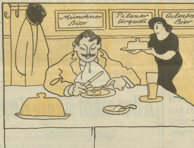
3. zu Mittag speßte ich in einer bayrischen Bierhalle,