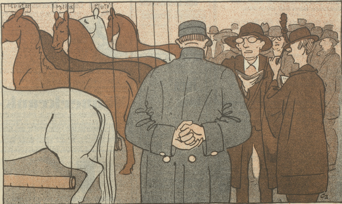
Im Pferdestall: „Über — äh — sagen Sie, wo sind denn nun hier die — äh — grünen Pferde?“