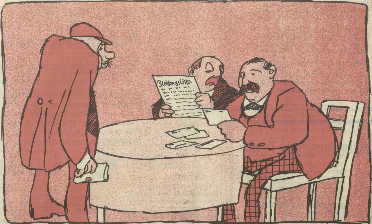
1. Der Ausstellungsloschwindel. Ein Kassafchlager mit deprimierendem Ausgang.