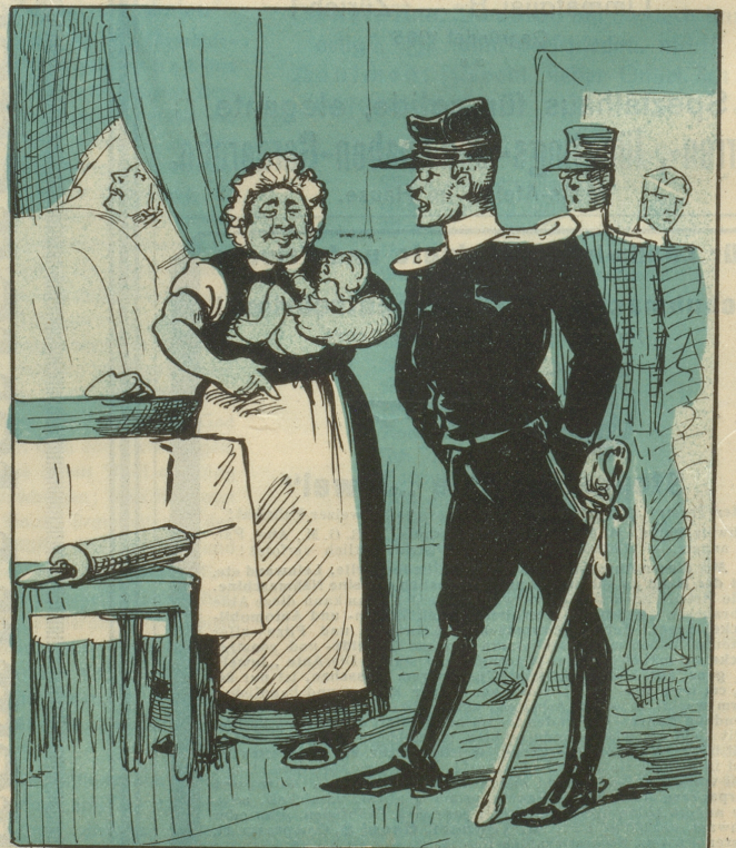
Um die Offiziere auf diesen neuen Dienstzweig vorzubereiten, werden Hebammenschulen für Subalternoffiziere eröffnet.