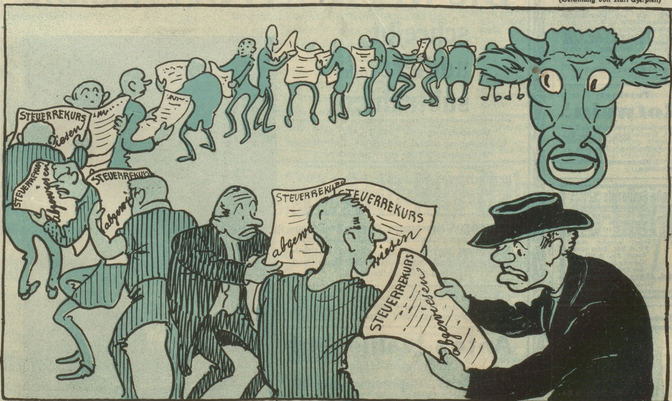
Manch einem wurde warm zu Sinn; manch einer hat die Stirn gerunzelt.