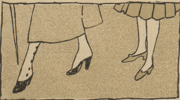
Mutter und Kind.