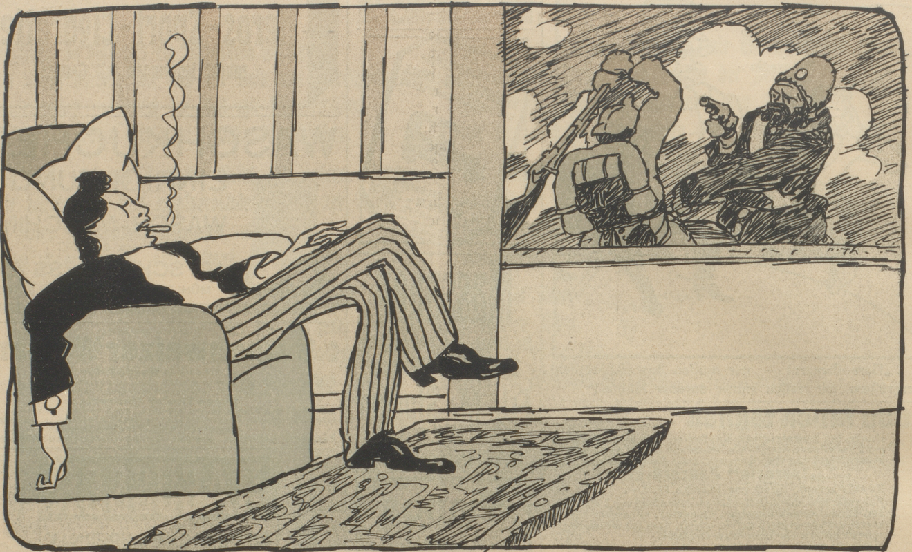
Der „ruhende Pol“ in der Erscheinungen Slucht.