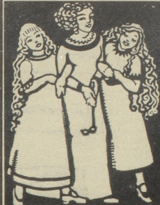
Frauen und Mädchen sind von der wunderbaren Wirkung von Grollichs Heublumenseife überzeugt u. kaufen nur diese.

Wer der Reklame aus dem Wege geht Den Zeitgeist nicht zu lassen versteht