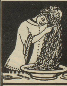
Kopfwuschungen mit Grollichs Heublumenseife entfernen Schuppen, stärken den Haarboden und machen das Haar voll und wellig.

Mütter! Wascht Eure kleinen Lieblinge mit Grollichs-Heublumenseife und auch Ihr werdet Euch an deren Gesundheit und rosigen Aussehen erfreuen. Grollichs-Heublumenseife ist in allen Apotheken, Drogerien, bei den Gärtnern, sowie in allen Konsumgeschäften zu haben. Man bitte sich vor Nachahmungen und nehme nur solche Heublumenseife, die aus Brünn stammt und Grollichs-Bild und Namen trägt. Mit einer gefälschten Heublumenseife würdest Du, lieber Lesler, diese Erfolge nicht erzielen. Nur Grollichs-Heublumenseife aus Brünn ist eine Gesundheits- und Schönheitsseife sans rival.