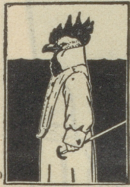
Gegründet 1890 220 Angestellte

Am Telephon kann man sogar eine Schwiegermutter für ein Bräulein halten.