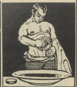
Tägliche Brustwaschungen mit Grollichs Heublumenseife fördern die Lungentätigkeit.