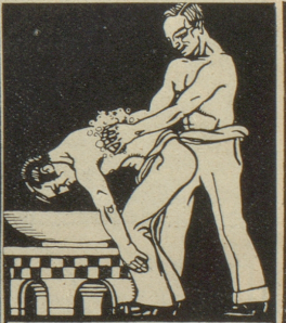
Tägliche Rückenwaschungen mit Grollichs Heublumenseife fördern die Lungentätigkeit.