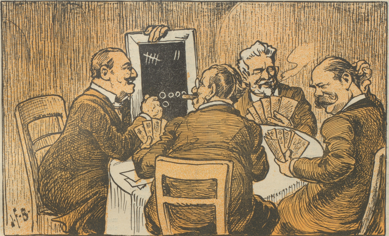
„Wenn Sie mit der Hördöpfelplantage so mitersahrid, denn chönd Sie sicher no e staatlíchlí Saatprämíe-n über.“