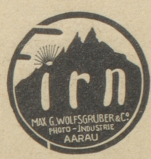
Photo-Artikel verbürgen beste Resultate Zu beziehen nur durch: Photo-Handlungen.