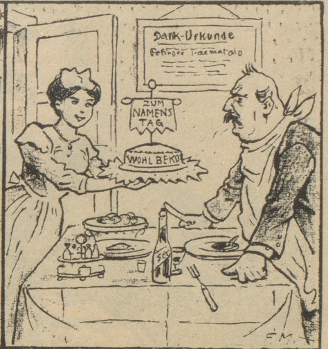
Aus Graz Köchin: So, Herr Direktor, heut' gib't was neues Delikates zum Namenstag, nämlich Haematalb-Gebäck! — Direktor: Ob d's abfahrst damit, Kindeih! Oder manß 'leicht, i bin a Kranker aus der Volksküchl?