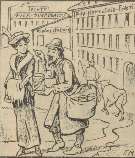
Der Hühnerhof rentiert nicht mehr, da die Eier-surrogat-Konkurrenzen in Form von Haematalb-Fabriken aus dem Boden wachsen.