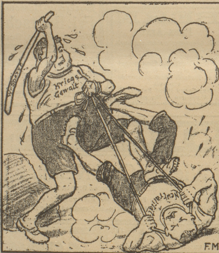
Solche Gerberei macht ja