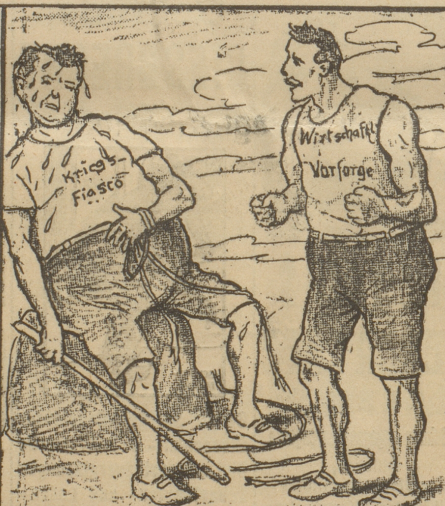
die Haut zu Leder.