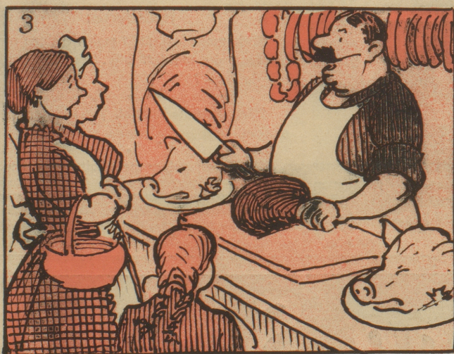
man kann sie beim Metzger als Speck kaufen, so man Geld hat.