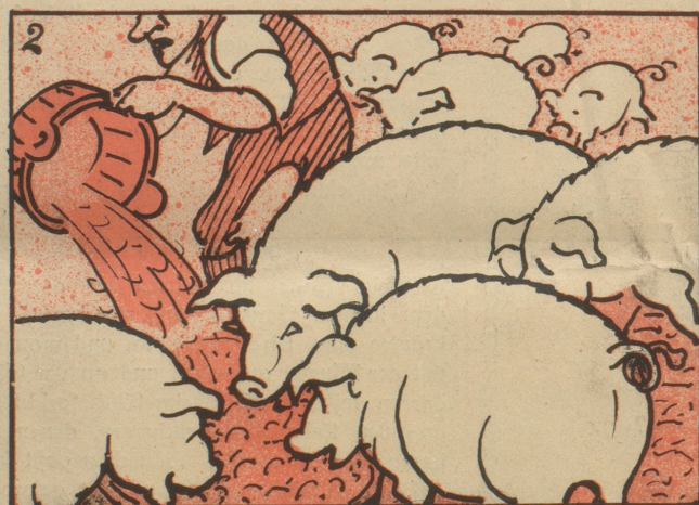
„Dann fressen sie halt eben die Säue und ...“