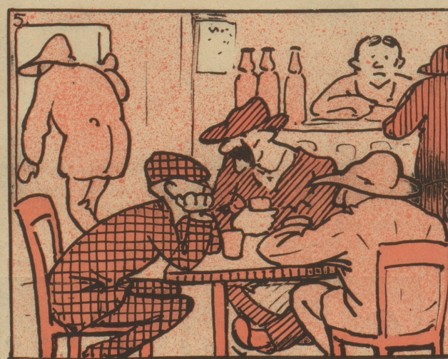
dem Alkoholzehntel auf die Beine.““