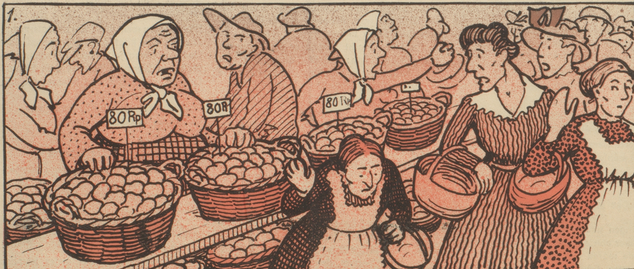
„Die Herdöpfel sind z'tür: die chaufed mir nüd.“