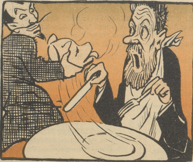
Dem Neutralen wird die Zufuhr abgeschnitten.