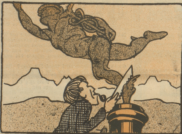
Der Handel wird ihm unterbunden.