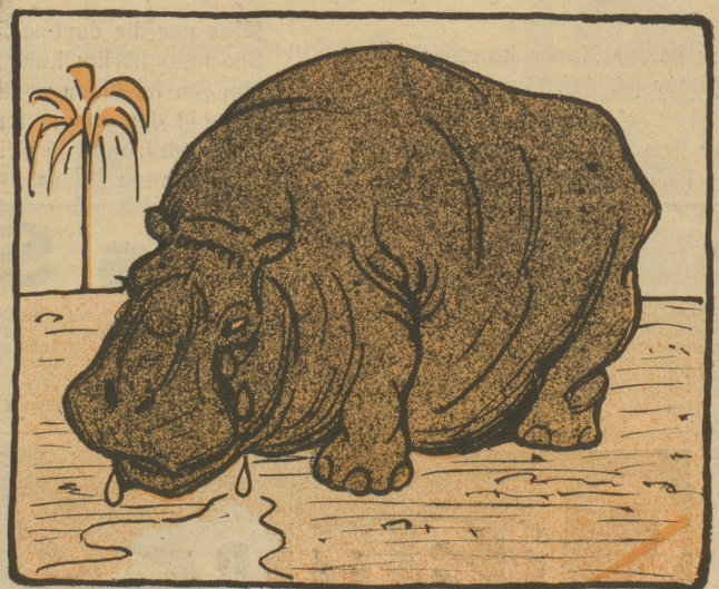
Und doch wird er von diesem Tier beneidet — seiner dicken Haut wegen.