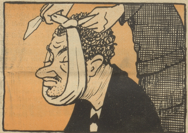
Das Maul wird ihm zugebunden.