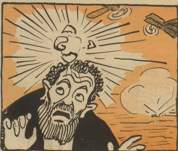
Die Neutralität seines Luftraumes wird verletzt.