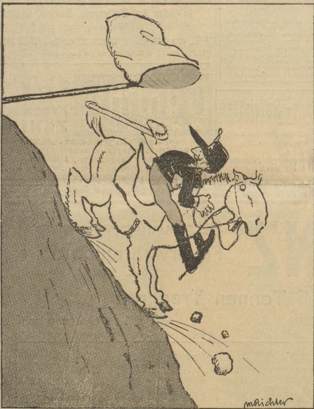
Serdinand: O, wie schön war's in Siebenbürgen! Aber verdammt abschüssiges Terrain!