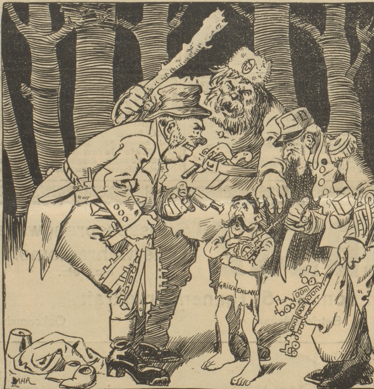
„Na, Kleiner, willst du nicht endlich unser Bundesbruder werden?!“