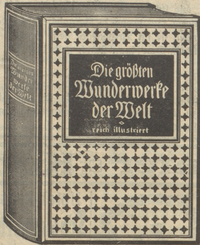
Grosser Prachtband 17 1/2 x 24 cm, mit über 500 Seiten und ca. 300 tells ganzseitigen Illustrationen, in Ganzleinen gebunden.