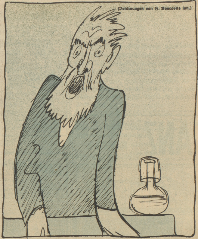
(Zeichnungen von S. Zecovits jun.)

„Diese stinkfaule Bourgeois-Gesellschaft wird niemals sich mehr einen Krieg intrigieren, sonst sind wir da, wir, die Broledarjer die größte Macht der Welt!“