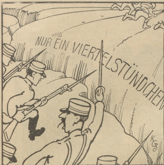
„Nur ein Viertelstündchen.“