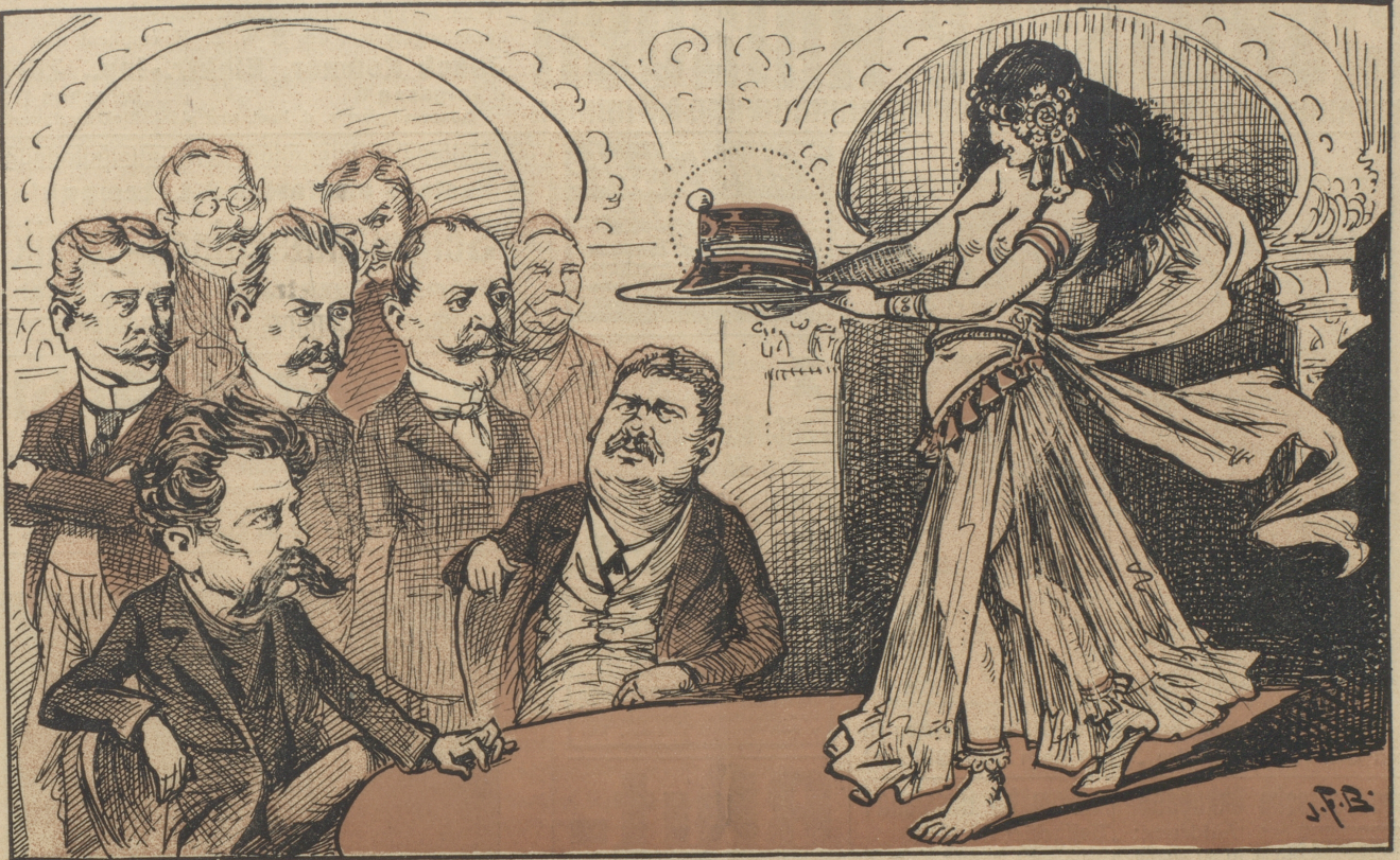
Die welsche Galome überbringt den „Compatriotes“ das Käppi des Generalstabschefs.