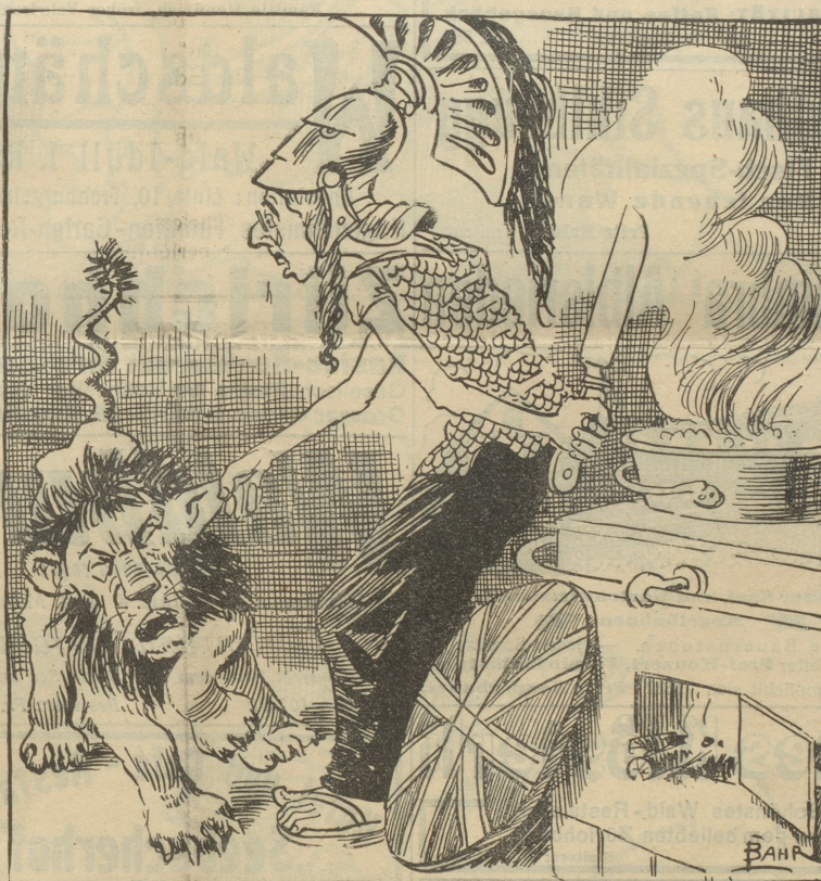
Auch der britische Leu muß dran glauben!