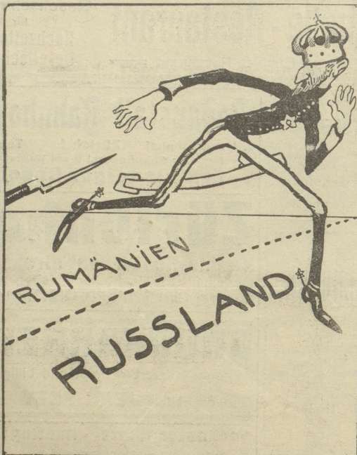
Ferdinand von Rumänien: „Alles hat feine Grenzen!“