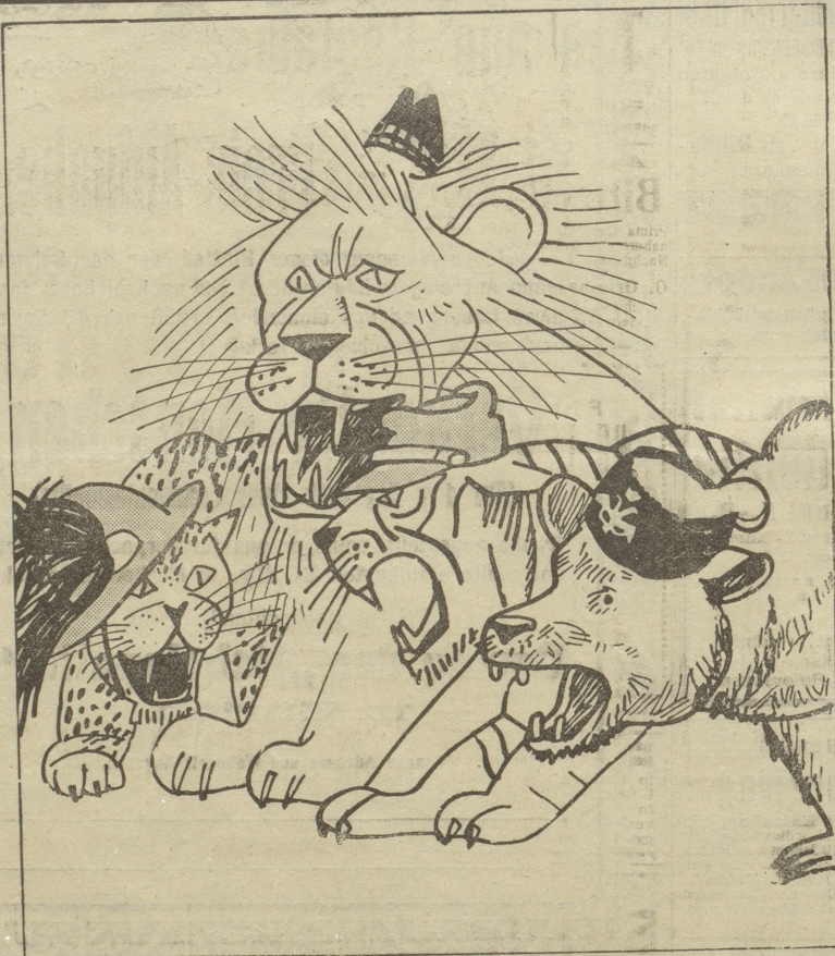
Die Antwort der Entente