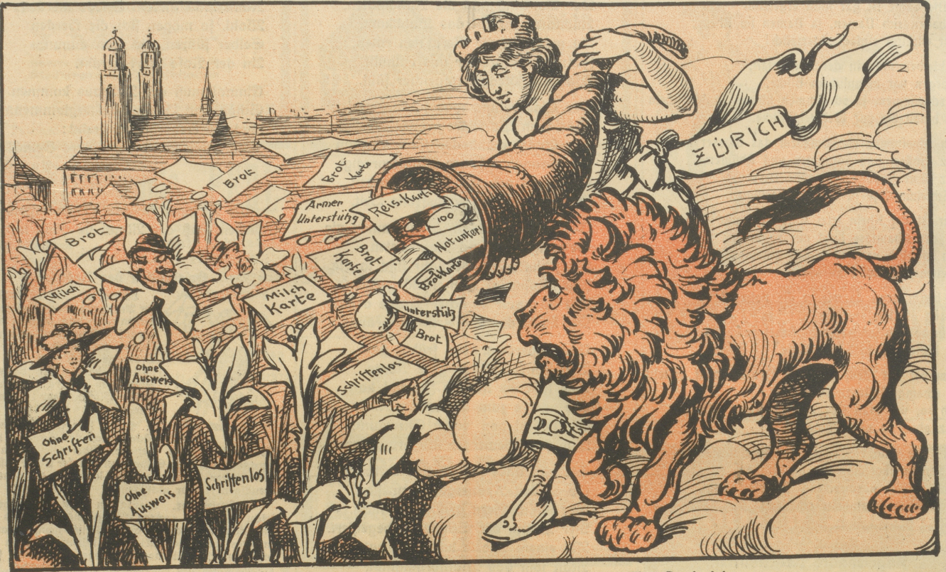
„Sie säen nicht, sie ernten nicht, aber — Frau Zurich ernährt sie doch!“