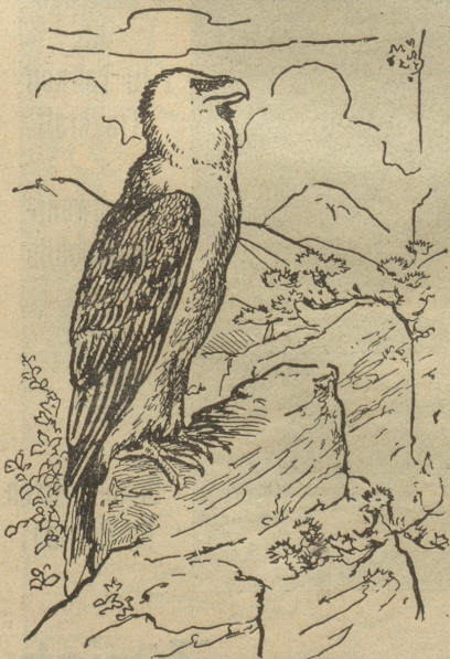
Wo ist die Beute des Geiers?