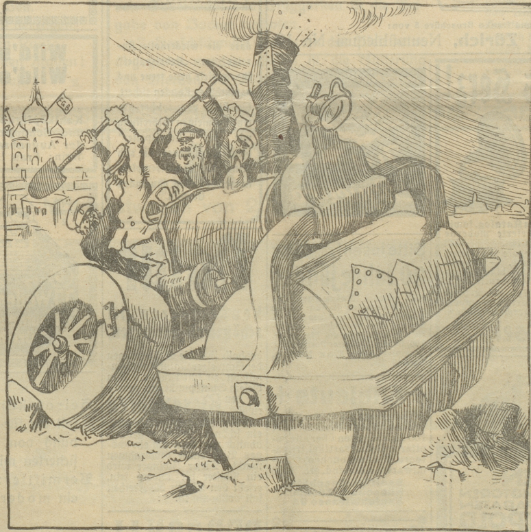
Ob die russische Dampfswalze in dieser Verfassung den Siegeslauf wieder aufnehmen wird?