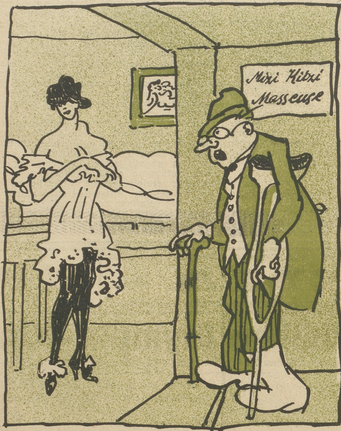
Sie: Pardon! Sie haben sich wohl geirrt!