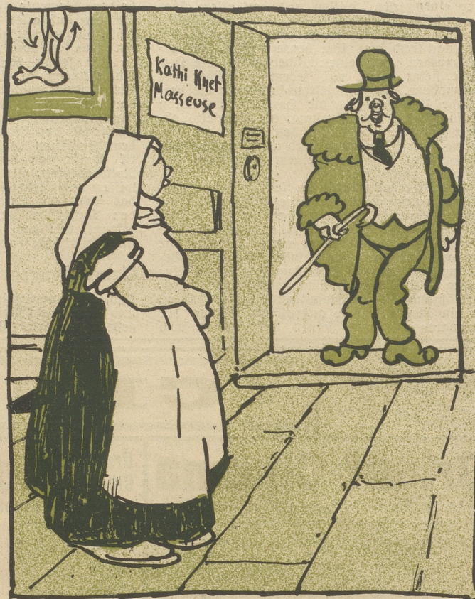
Er: Pardon! Ich hab' mich wohl geirrt!