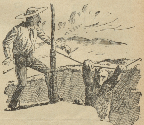
Ein letzter reifender Gedanke: Das Boviemesser 'raus, das blanke!