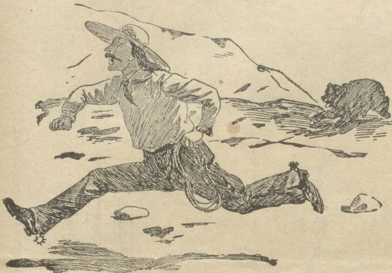
Ein Bär — ein Bär — ich bin verloren! Was helfen ohne Koff die Sporen?!