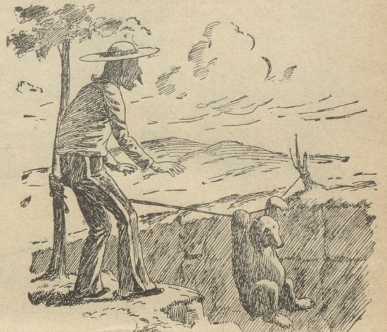
Was seh' ich? Dieser zott'ige Brummer Macht spielend nach die Zirkusnummer!