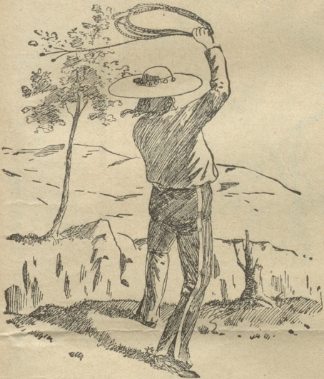
Ein Abgrund gähnt! O Welt der Lücken! Der Lasso muß ihn überbrücken!