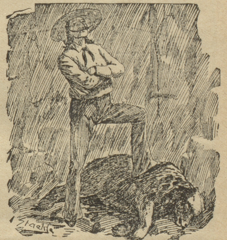
Es siegt des Menschen Intellekt: Ursus brummosus ist verreckt.