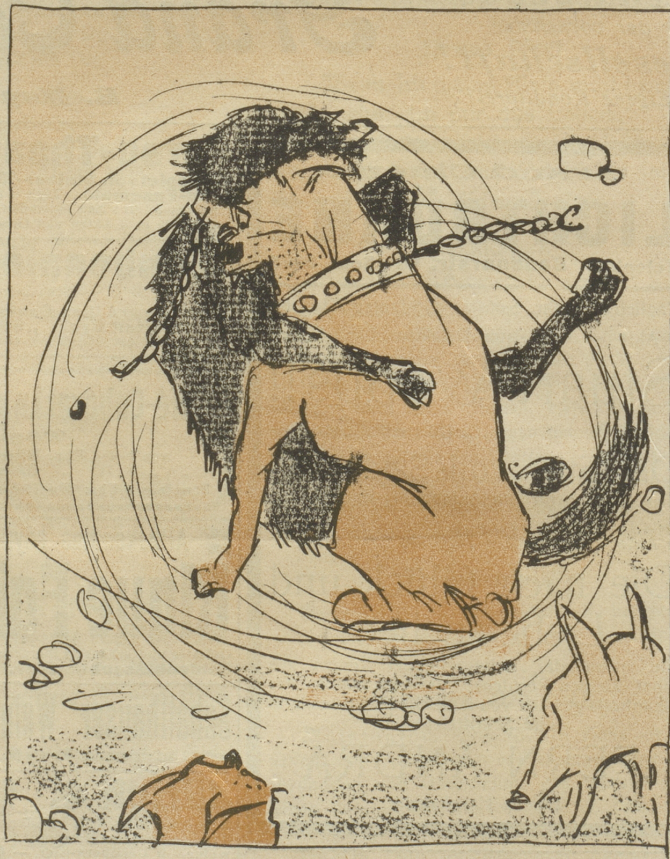
Drauf beide Köter sich zerbläuten, Woran sich dann die andern freuten!