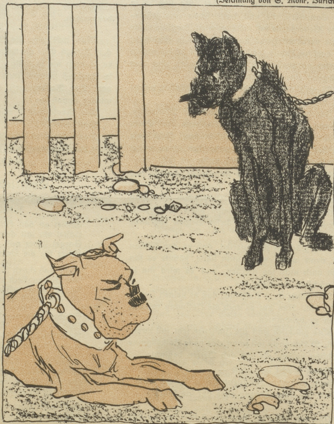
Das Volksrecht und die Tagwacht, Sie standen beide auf der Wacht.