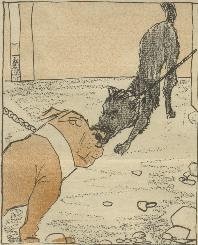
Bis eines Tag's das Volksrecht schrie: „Die Tagwacht leidet an Nobisphobie!“