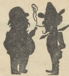
Dammhofer vom „Magimum“!

Direktor: Das verbitte ich mir! Sie haben nicht das Recht, meine persönliche Ansicht durch Teilung zu zerstückeln!