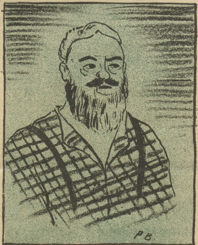
Er verzichtet sogar auf den martialischen Stehkragen und läßt sich, das Rasieren als Luxus betrachtend, nach berühmten Mustern einen Vollbart wachsen.