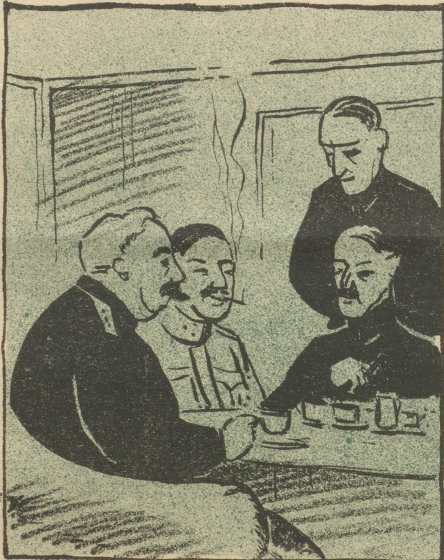
General a. D. Ulrich Wille, der im bundesstädtischen Hauptquartier des „Bellevue Palace“ beim Generalführer-Jaß Mokka mit fin Champagne schlürfte. —