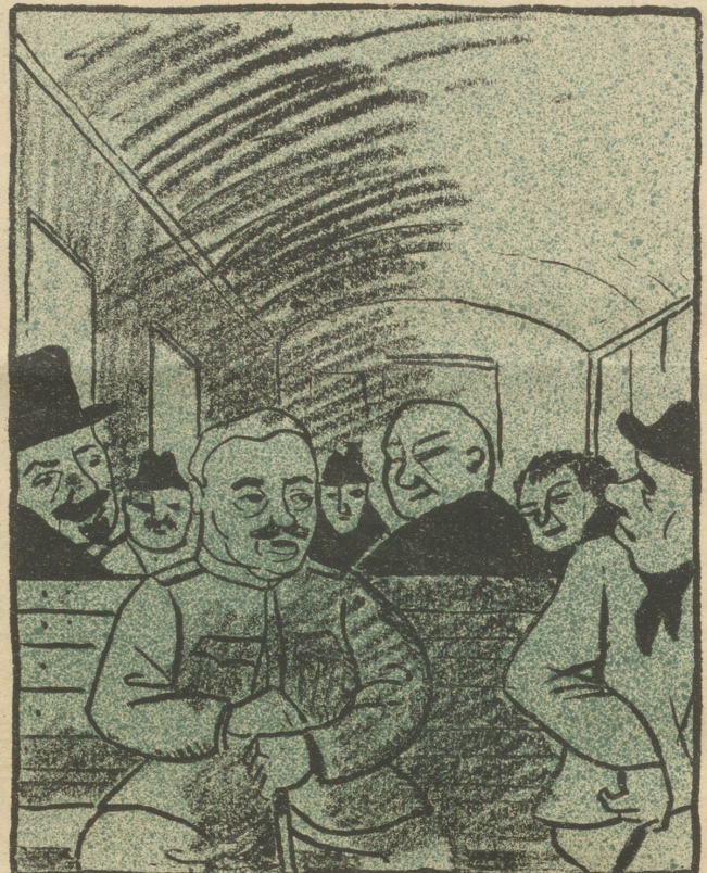
will in Zukunft nur noch 3. Klasse fahren.