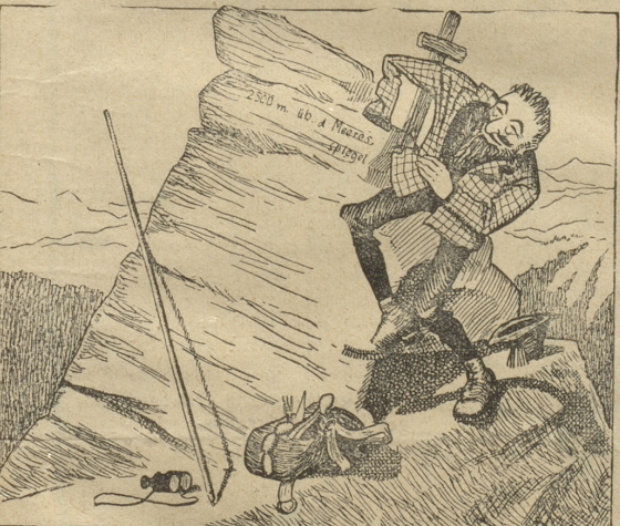
„Galt es könnte mir doch gelingen — wenn ich mich selber als Räuber umkleide. — Nun aber schnell!“