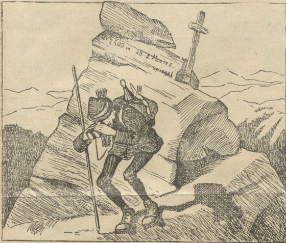
Tourist: Himmel! Dort unten kommen zwei Räuber herauf!