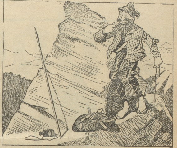
„So, jetzt noch den Bart recht gegen den Strich.“