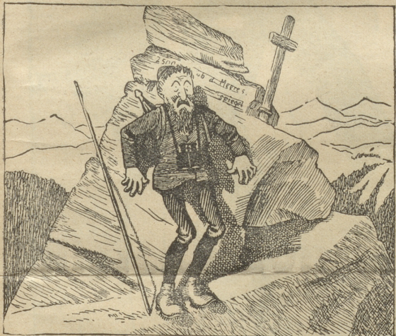
„Ich bin verloren, denn hier kann ich unmöglich entkommen!“