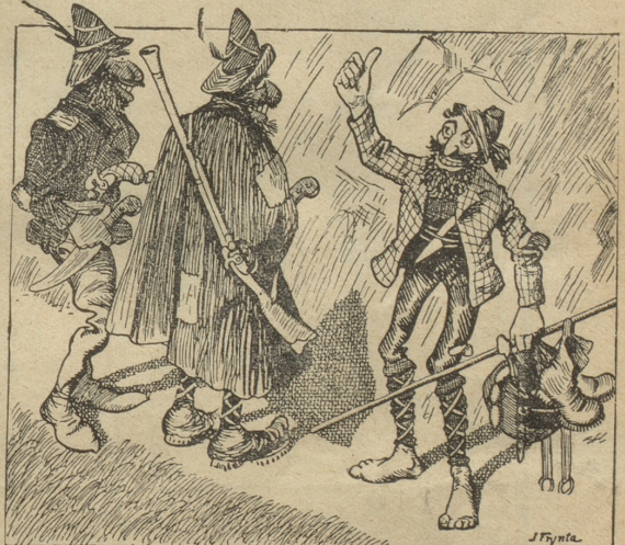
„Da hat es keinen Zweck mehr, daß wir noch hinaufklettern.“ Der Touristen-Räuber: O, nur schnell hinauf, dort ist noch viel zu holen. —