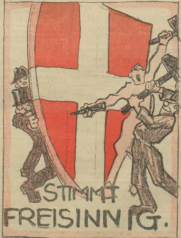
Neue, vom Nebelpalmer vorgeschlagene Plakatenwürfe.