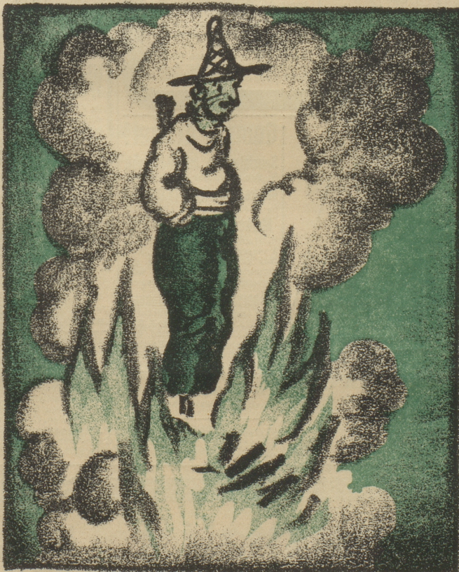
In Züri würd' er — sapperment! — Als intressanter Böögg verbrannt!