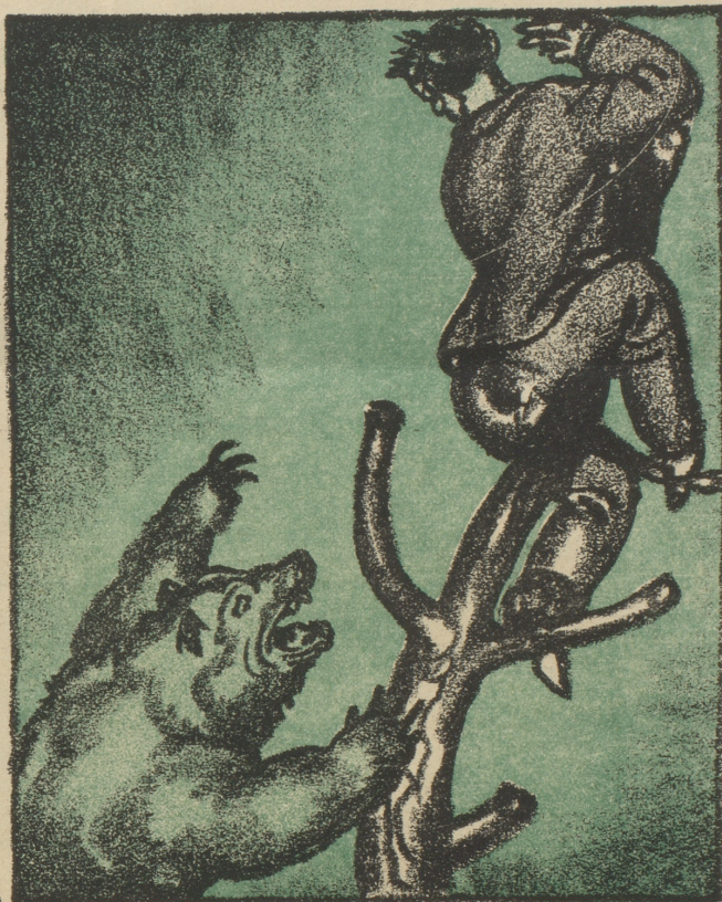
In Bern müßt' er — es wär' zum lachen! — Bekanntschaft mit den Mützen machen!