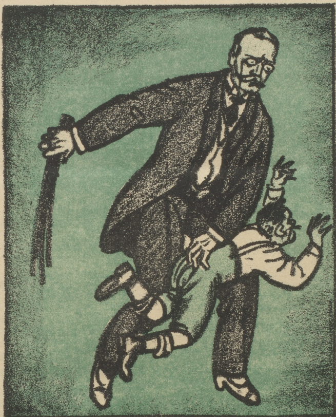
Du machst Verdruß uns viel, mein Sohn! Säb nume still —! Das kommt davon!